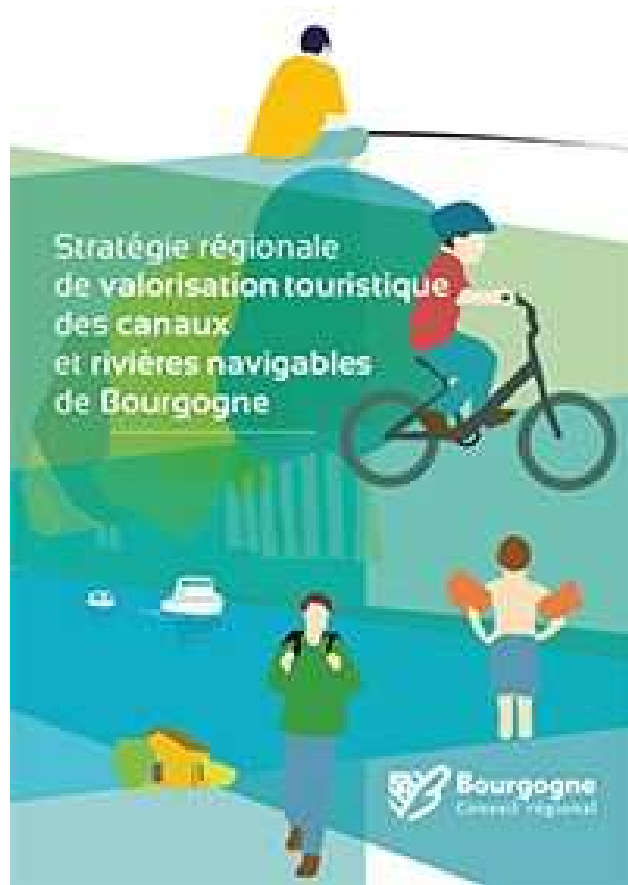
la "Valo Cano"

Stratégie régionale de valorisation touristique des canaux et rivières navigables de Bourgogne